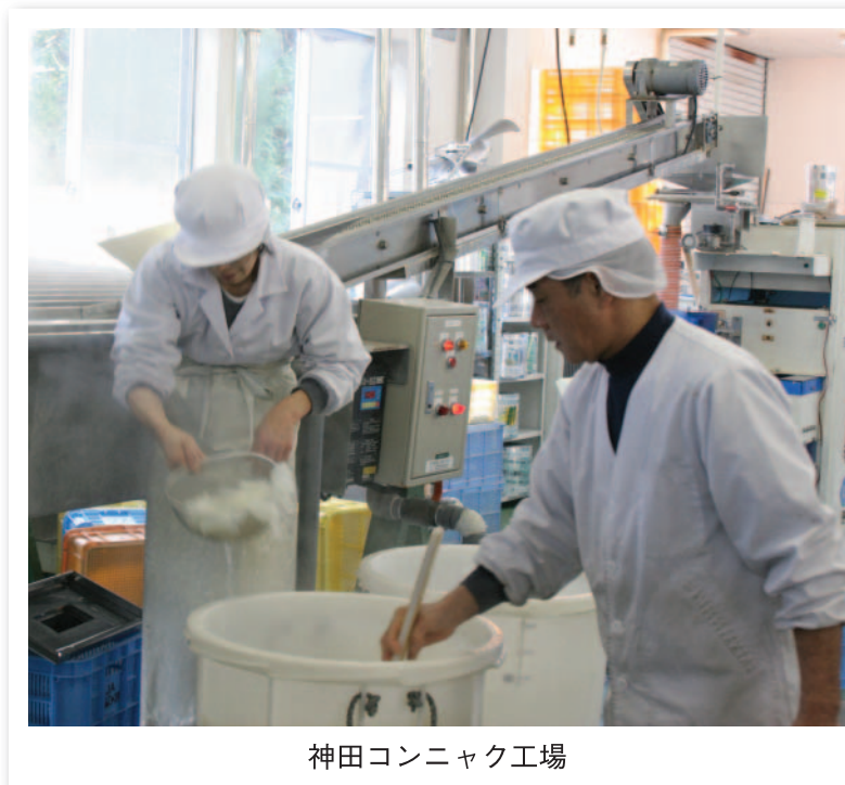
神田コンニャク工場