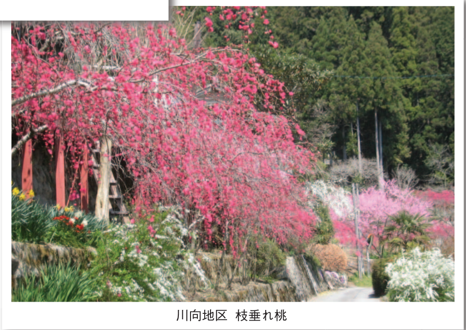
川向地区 枝垂れ桃