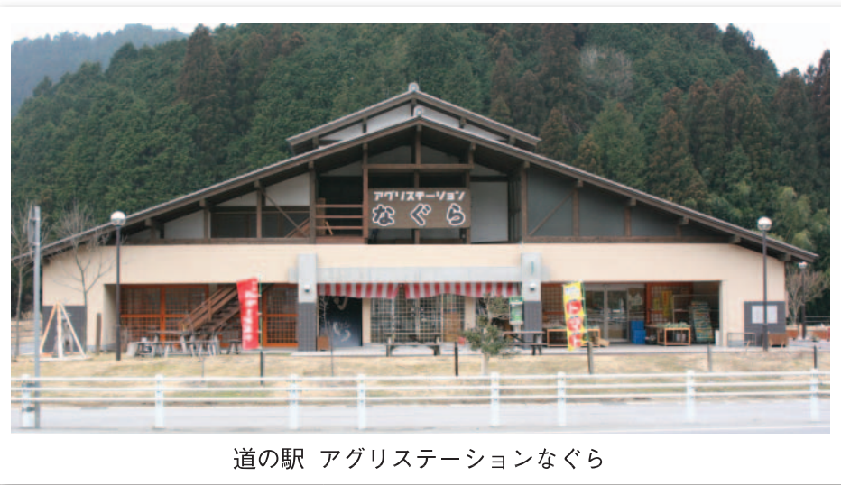
道の駅 アグリステーションなぐら