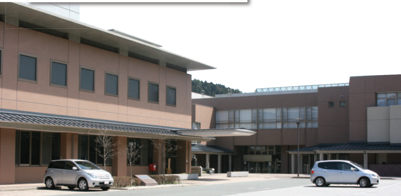
津具総合支所・つくグリーンプラザ