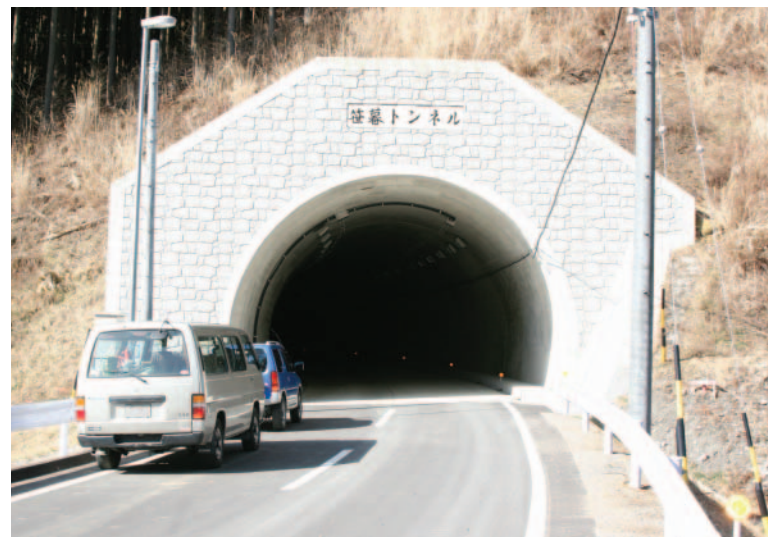
広域農道 笹暮トンネル