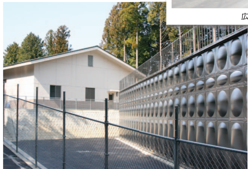
田口簡易水道浄水場