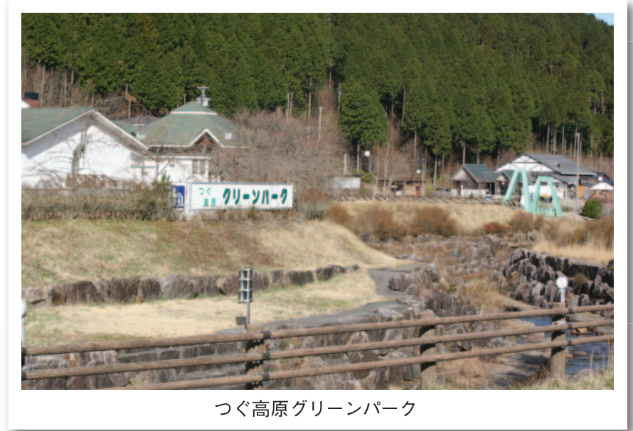
つぐ高原グリーンパーク