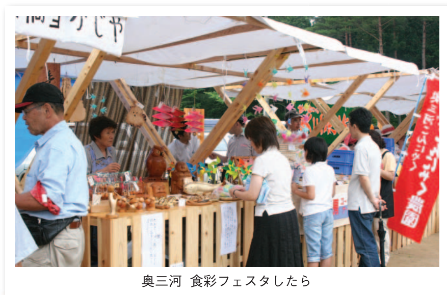
奥三河 食彩フェスタしたら